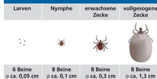
Abbildung 2