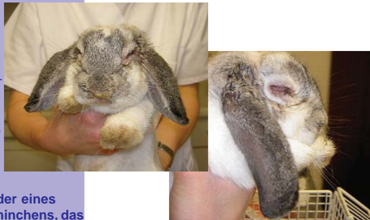
Bilder eines Kaninchens, das an Myxomatose erkrankt ist. Typisches Merkmal: starke Schwellungen der Augen.

Ansteckungsgefahr auch für Wohnungskaninchen